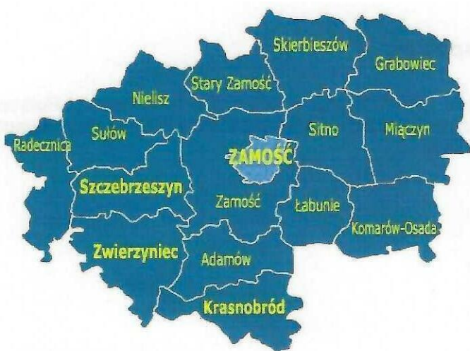
Rys. 2 Gminy wchodzące w skład Powiatu Zamojskiego.